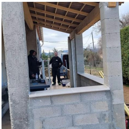
Fermeture d'une terrasse