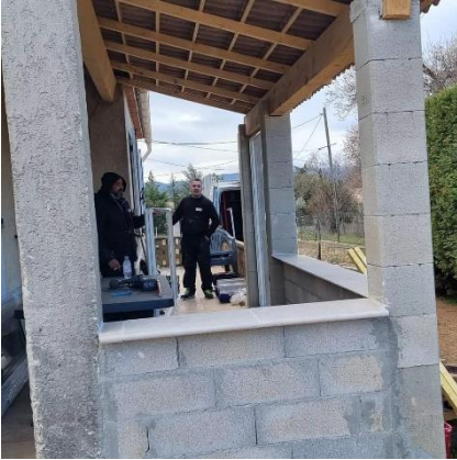
Fermeture d'une terrasse